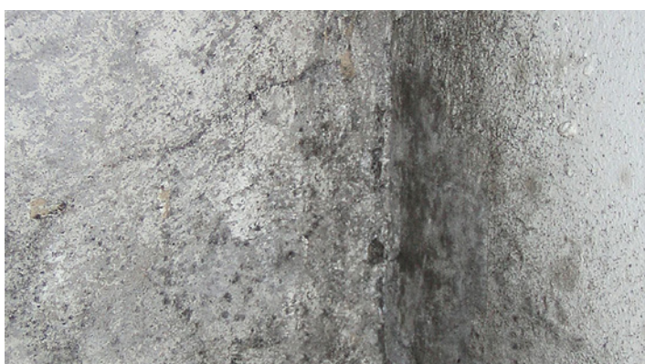
Putsad vägg i källare, svart av påväxt.