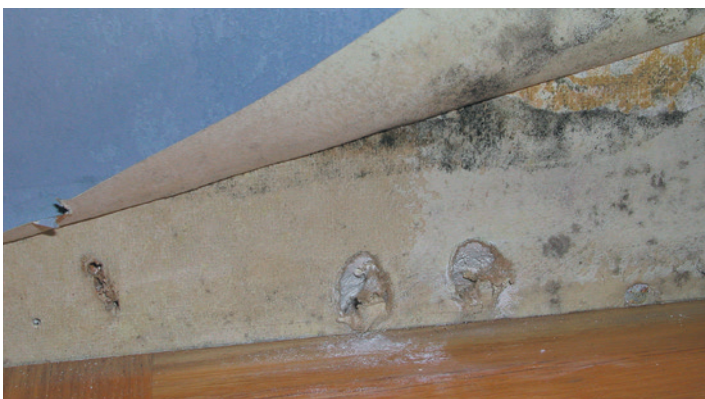
Mögelangrepp på gipsskiva under tapet.