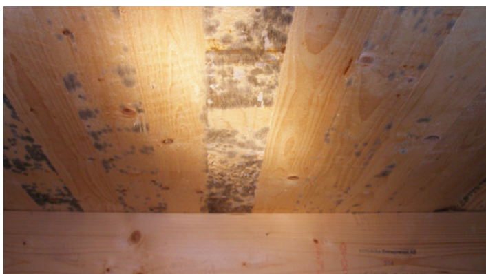
Krypgrund med kraftig påväxt av mögel.