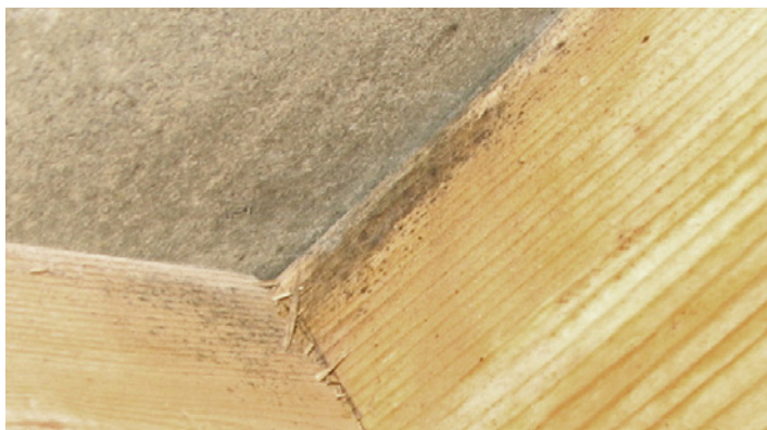
Takstol med mögelangrepp.