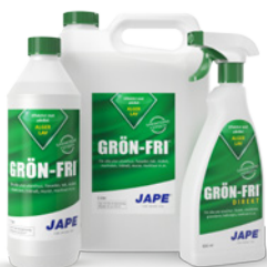
Volym: 1 liter 5 liter 0,5 liter Art.nr. 13012 13024 13011

En serie effektiva desinfektions- och rengöringsmedel från Jape. Väljer du dessa produkter får du ett heltäckande system för underhåll av fasader och andra ytor. Samtliga produkter är biologiskt nedbrytbara.