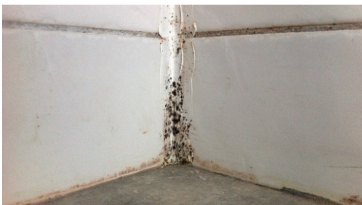
Mögel i kakelfog och silikonfog.