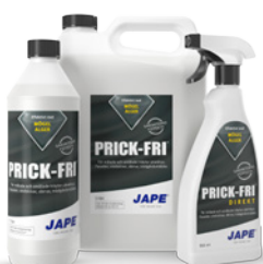
Volym: 1 liter 5 liter 0,5 liter Art.nr. 13712 13724 13711

1 flaska Grön-Fri Direkt räcker till ca 2,5 m 2 (spädes ej)